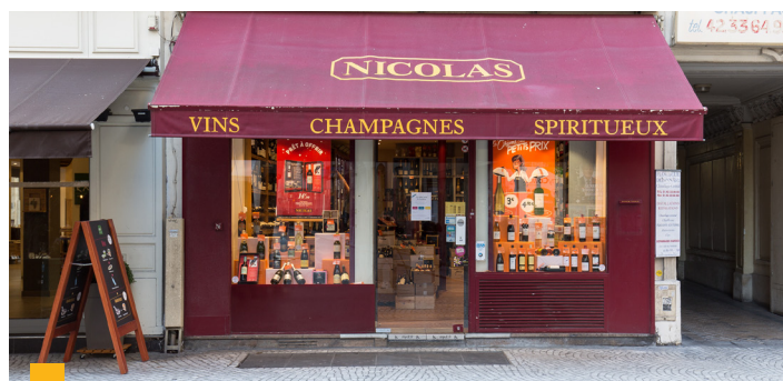
61, rue Montorgueil à Paris (2 ème )

Votre SCPI a engagé la cession de trois actifs difficiles, à Arras (62), Périers (50) et Nogent-le-Rotrou (28). Celui d'Arras a trouvé acquéreur à un prix en ligne avec la valeur d'expertise, générant une plus-value par rapport à la VNC. Pour les deux autres actifs en revanche, des promesses ont été signées à des valeurs dégradées au regard du manque de profondeur de marché sur ces opérations. Pour ces trois actifs, la réitération est prévue au début du 2 nd semestre.